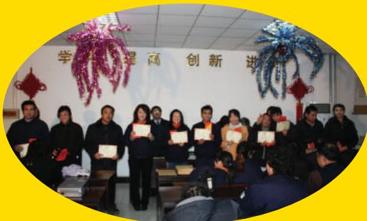
为“先进工作者”授予荣誉证书并发放奖金