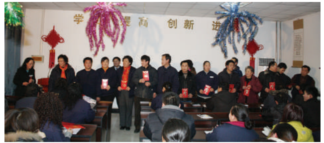
广大员工在领取工龄奖

员工对企业的忠诚是企业的财富，也是企业保持生机活力的核心力量，员工对企业的忠诚除了表现在工作态度上，也体现在工作时间的连续稳定程度上。日光不会忘记历史，更珍惜今天。按照公司人事管理制度，每年年底要为符合条件的广大员工发放工龄奖。这份奖项，是答谢员工对日光的信任与忠诚，答谢员工的勤奋和不懈努力；这份奖项既表示对员工的尊重，也是表示鼓励。